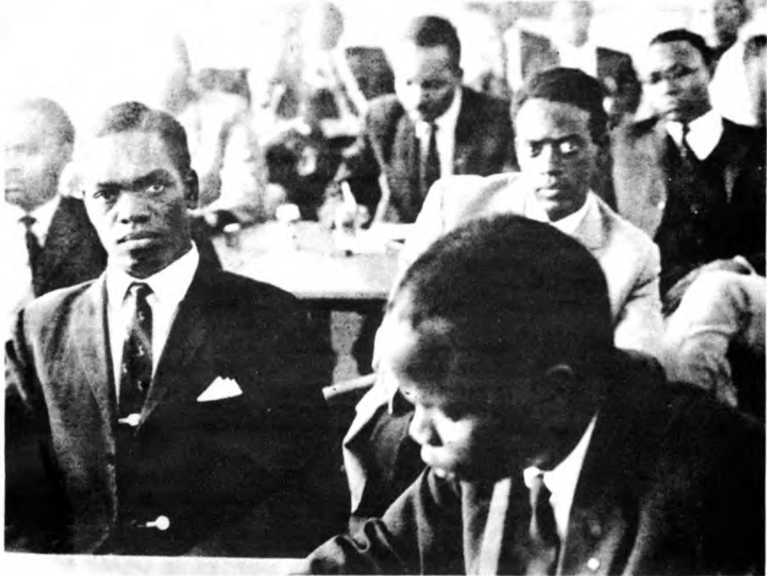
Ruotsissa pidetyn yhdeksännen kansainvälisen osuustoimintaseminaarin 24 kenialaista, tansaniaalista, ugandalaista ja sambialaista osanottajaa vieraili eilen Salossa Suomeen tutustumismatkinsa yhteydessä.