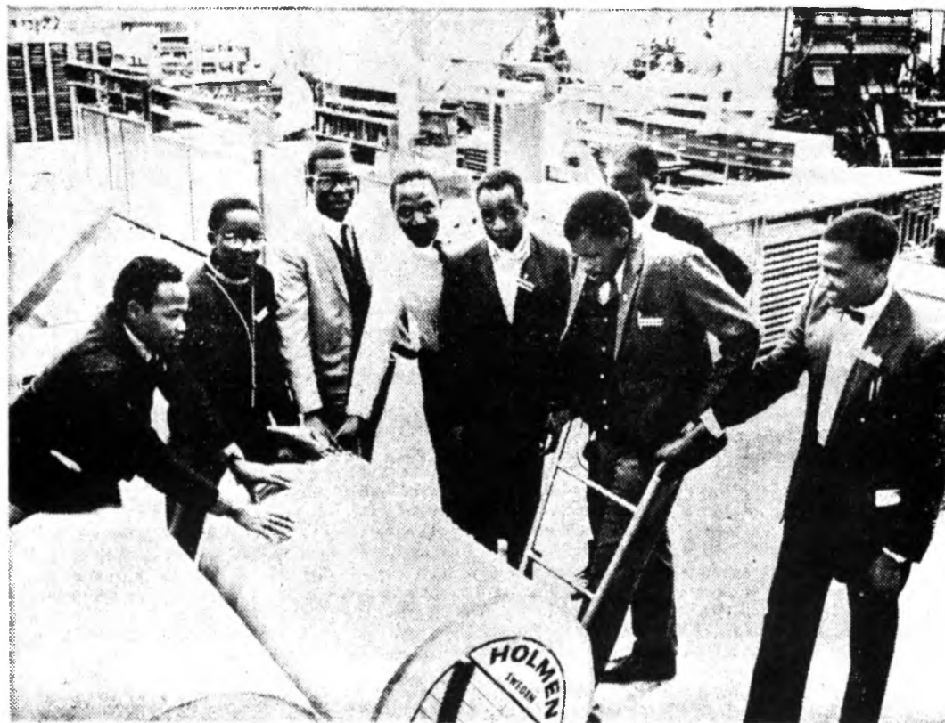
Afrikanerna hann också med ett studiebesök på VF under måndagen

I morgon kommer de att besöka en jordbrukare i Brotorp, äta lunch på slakthuset i Kil, besöka jordbruksskolan i Lillerud och Vänerskog. Innan gruppen återvänder hem den 15 april skall de bl.a. ha hunnit med ett besök på Värmlands mejerier, delta i en studiekurs i metodik på Gylleby säteri, besöka Ransäter och studera vuxenskolan.